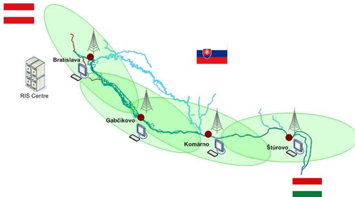
Схема расположения и покрытия береговых станций АИС на словацком участке и на совместных словацко-австрийском и словацко-венгерском участках Дуная